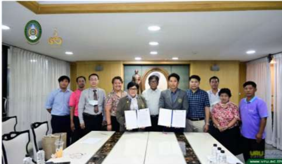
พิธีลงนามบันทึกข้อตกลงความร่วมมือ (MOU) โครงการจัดการพลังงานในองค์กรด้วยระบบดิจิทัล (Digital Platform) ระหว่าง มวก.วไลยอลงกรณ์ ในพระบรมราชูปถัมภ์ กับ การไฟฟ้าส่วนภูมิภาค